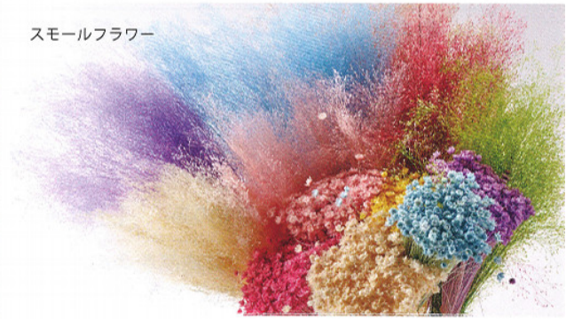
スモールフラワー