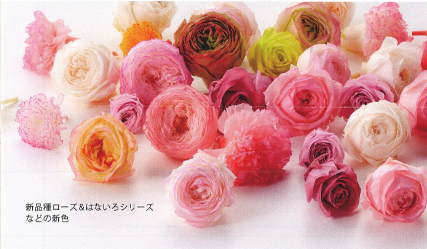
新品種ローズ&はないろシリーズ などの新色