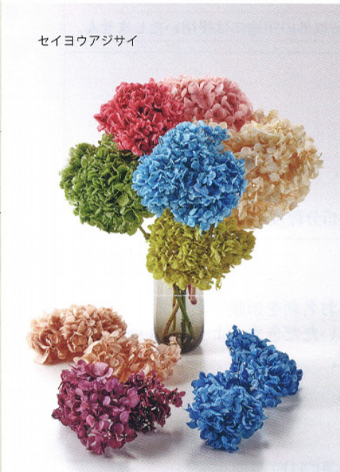
セイヨウアジサイ